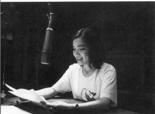
▲舌つたらずな感じが特徴の弥生さん。多感なミーナを元氣いっぱい演じてくれました。